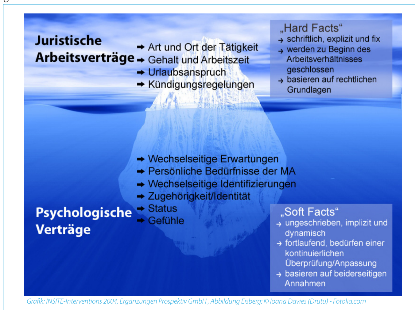
Grafik: INSITE-Interventions 2004, Ergänzungen Prospektiv GmbH, Abbildung Eisberg: © Ioana Davies (Drutu) - Fotolia.com

Da die gegenseitigen Erwartungen häufig nicht an- oder ausgesprochen werden, kommt es so oftmals zu „Mißverständnissen“. Dabei wäre ein regelmäßiger Austausch über die gegenseitigen Erwartungshaltungen sehr wichtig. Denn während intakte psychologische Vertragssituationen einen starken motivationalen und leistungsfördernden Einfluß auf Arbeitsbeziehungen haben (s. o.), so führt im Umkehrschluss eine kontinuierliche Nichterfüllung der Erwartungen (der „Bruch“ des psychologischen Vertrages) sowohl auf Arbeitgeber- als auch auf Arbeitnehmerseite zu Frustration und Unzufriedenheit, was wiederum negative Auswirkungen auf die individuelle Arbeitsbeziehung als auch auf das gesamte Arbeitsklima hat.