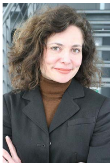
Stimmen aus der Praxis

Aus diesem Grund werden im Rahmen von GeMiNa gemeinsam Mitarbeitergespräche weiterentwickelt, welche die Thematik des psychologischen Vertrags aufgreifen und bei „Explizierung“ von gegenseitigen Erwartungen helfen sollen. Hierdurch soll auch eine Verbesserung der WLB der Beschäftigten erreicht werden, wovon die Unternehmen ebenfalls profitieren (Win-Win-Situation).